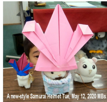
A new-style Samurai Helmet Tue, May 12, 2020 MBs

www.shihoya.com ⇒ 「Welcome to LL」には、「卒業生の声」や生徒と共に長年培ってきた「英語の話題」、「LLアーカイブ」、「雑学」等が、たくさん詰まっています。BLOGは毎月20回以上の更新を目指しています。